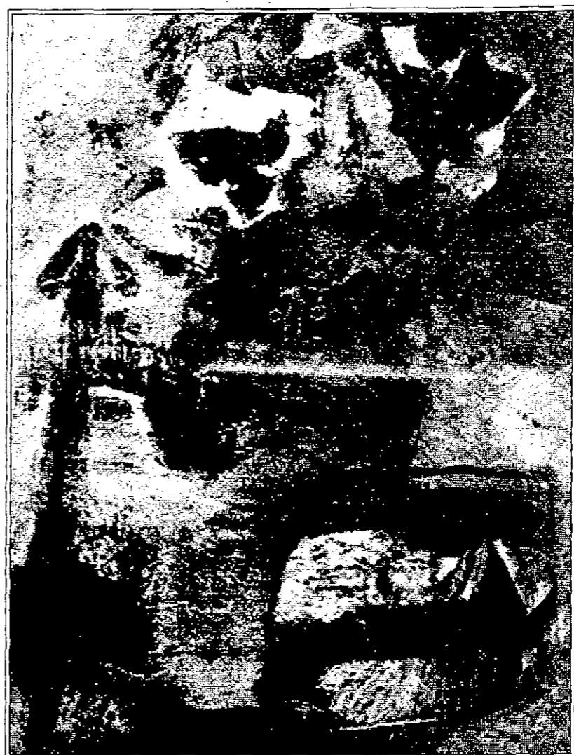
دالي وبيكاسو وميرو من المشاركين في معرض «تسعة المتوسط»